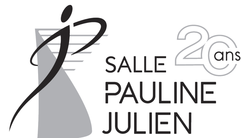
TABLE D'HÔTE SPECTACLE SALLE PAULINE-JULIEN

Partenaire depuis 2001! Sur présentation de vos billets de la Salle Pauline-Julien, le soir du spectacle, La Maison Verte vous offre une table d'hôte spéciale de 4 services à 26$.